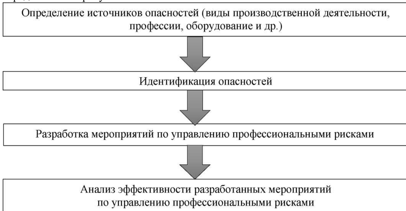
Рисунок 2. Процесс идентификации опасностей и оценки профессиональных рисков

Процесс идентификации опасностей и оценки профессиональных рисков представлен на рисунке 2.