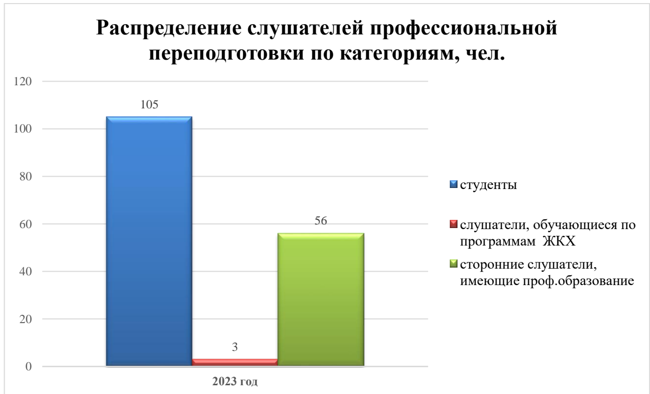
Рисунок 1 – Распределение слушателей профессиональной переподготовки по категориям