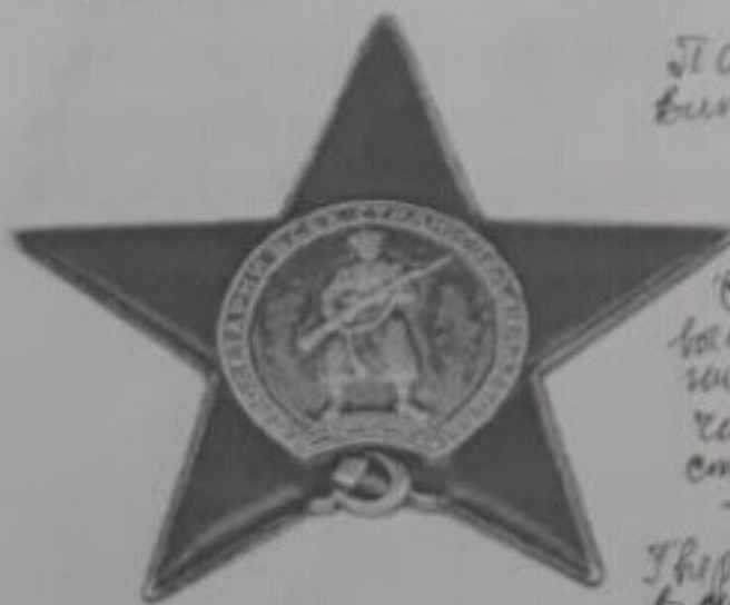
Орден Красной Звезды 15.11.1944