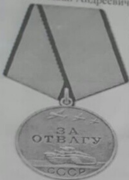
Медаль «За отвагу» 30.10.1942

Приказ Войском Западном фронте - О награждении лично составом 30 октября 1942 г. № 01175 заместителя Директора От имени Президиума Верховного Совета Союза ССР за образцовое выполнение боевых заданий командованием на фронте борьбы с немецкими захватчиками и выдающиеся при этом доблесть и мужество - Наградить - По Старейшему кавалерийскому корпусу - Медалью «За отвагу»