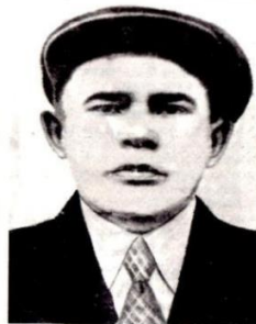
«Никто не забыт, ничто не забыто»

В этом году исполнилось 75 лет с тех пор, как началась Великая Отечественная война. Оборона Брестской крепости стала одним из самых первых кровопролитных ее сражений.