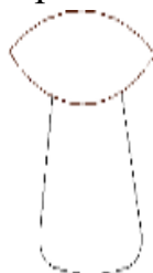
Рисунок 5.2 – Чертеж гриба